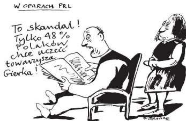
2013, rys. Andrzeja Krauzego 25

Na zakończenie warto też wspomnieć o fakcie, wyłamującym się z idei „dekomunizacji” Polski – Ślązacy nie chcą usunąć z ulic, placów i instytucji nazwisk Edwarda Gierka i Jerzego Ziętka [Dziadul, 2017], a także pomników ostatniego. Obaj niewątpliwie są dobrze wspomniani na Śląsku. Gierek powrócił po wojnie do Polski z Francji, a nie na sowieckich czołgach i łatwiej się żyło „w jego czasach”, Ziętek zaś był wyjątkowo cenionym przez społeczność śląską gospodarzem regionu.