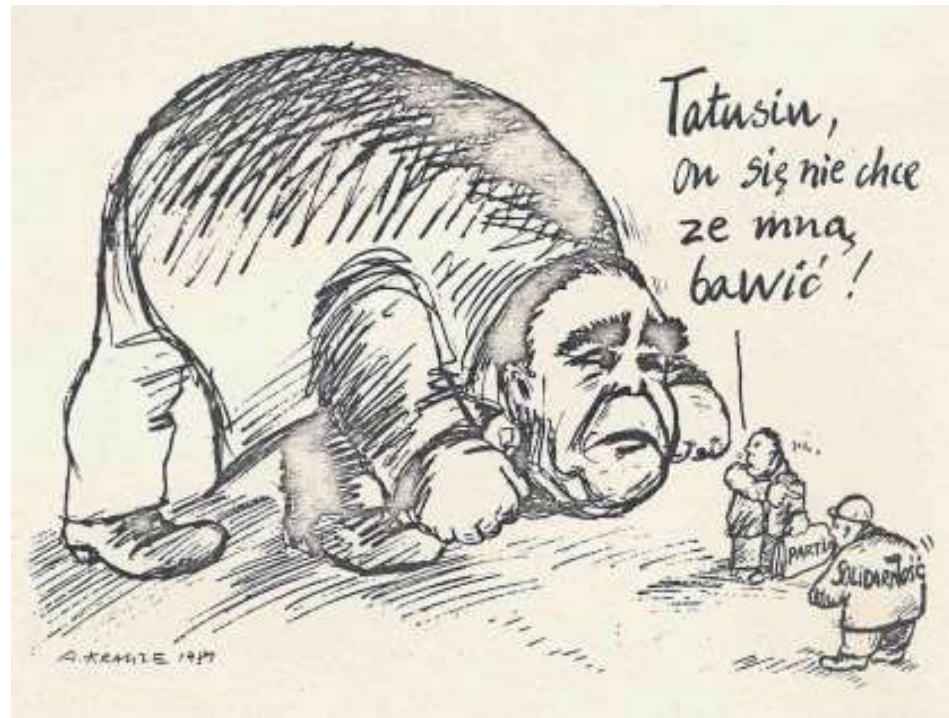
1981 [Lazari, Riabow, Żakowska, 2013: 245] 9

w Londynie). W Polsce zasłynął podczas stanu wojennego rysunkami w wydawnictwach podziemnych: